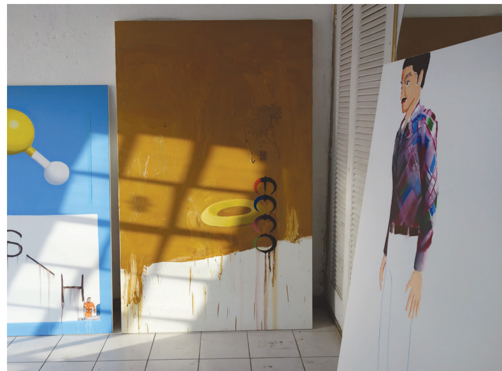
vista do ateliê de Gabriel Secchin / view of Gabriel Secchin's studio